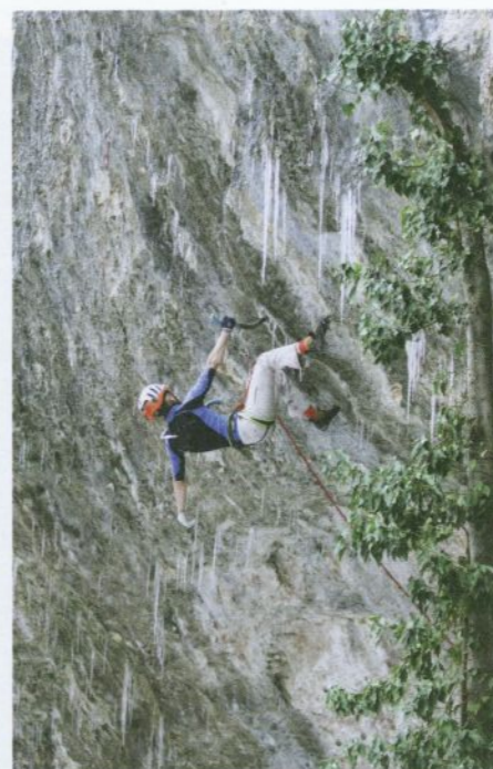
Dokonalé „přichytky“ v podobě cepínů a „maček“.

V roce 1902 uspořádali Němci závod vojenských hlídek, při němž se běhalo na lyžích a střílelo. Na třech předváleč-